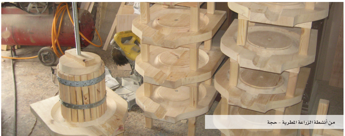
من أنشطة الزراعة المطرية - حجة

تم إنجاز المستوى الأول والثاني من تكوين المجموعات واستكمال بناء قدراتها بشكل مُرضٍ، ففي حجة تم تكوين وتدريب 28 مجموعة إنتاجية بين المجموعات متنوعة الأنشطة (تشتيل، خضار، إنتاج وتسويق النحل ومشتقاته، إنتاج دواجن...). وكذا تكوين وتدريب 300 مجموعة إنتاجية في المستوى المحلي... ليصل بذلك عدد المجموعات المكونة والمدرّبة بين المجتمعات في