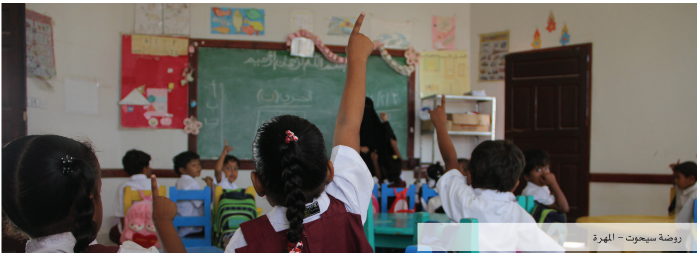
روضة سيحوت - المهرة

تم الانتهاء من تصميم وصف وإخراج منهاج المهارات الحياتية لدارسات فصول