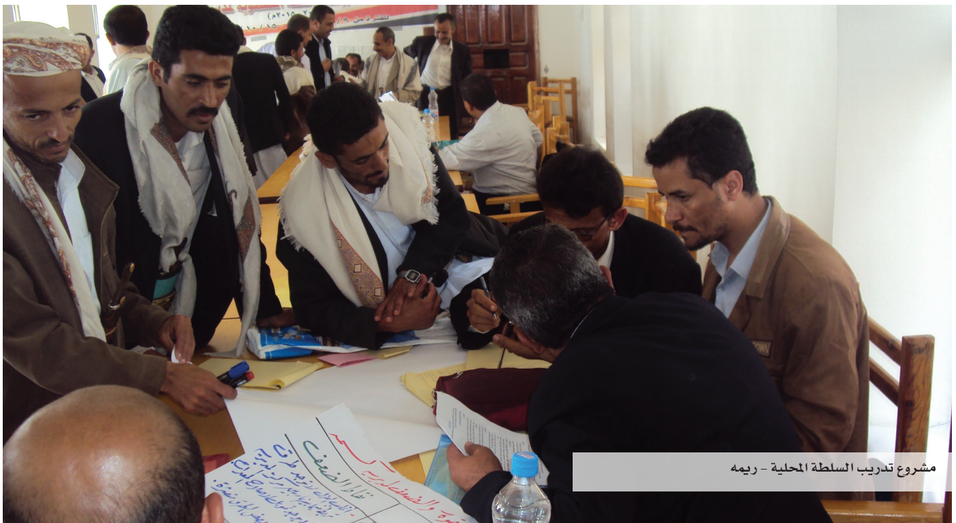
مشروع تدريب السلطة المحلية - ريمه

هذا البرنامج ممول من قبل البنك الدولي ودخل إلى حيز التنفيذ في 4 / 11 / 2014 م.